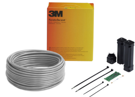
Osprzęt do instalacji elektrycznych