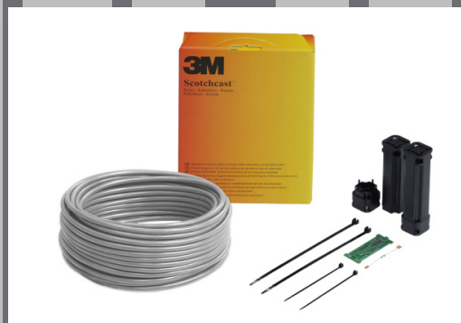
Osprzęt do instalacji elektrycznych