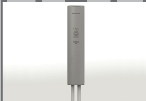
Czujnik TORSUS 50